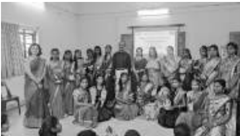
पोषण सुंदरी स्पर्धा