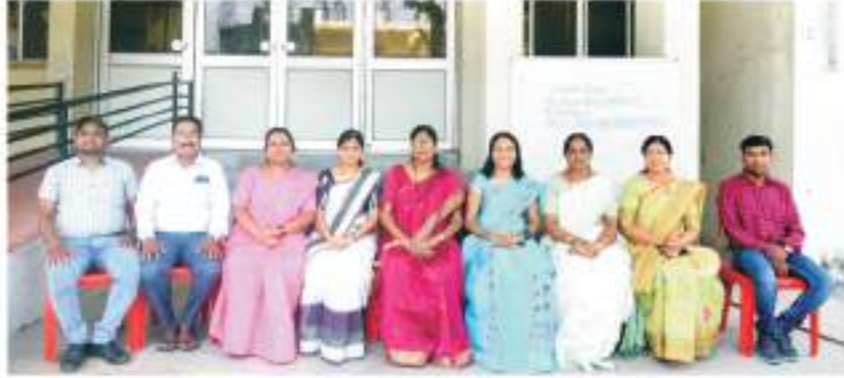
प्राचार्यासवे कनिष्ठ महाविद्यालयाचे प्राध्यापक वृंद