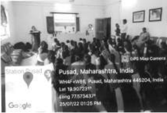
Guidance & Practical (yoga)