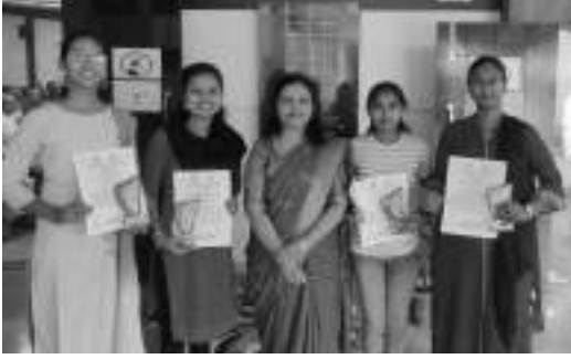
करीअर कट्टा च्या वतीने पारीतोषीक विजेत्या विद्यार्थिनी