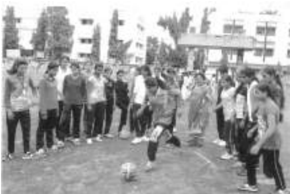
Intramural Competition Football

BADMINTON | YOGASAN | ATHLETICS | SOFTBALL | BASEBALL | CRICKET | FOOTBALL BADMINTON COMPETITION