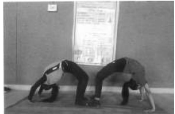
Intramural Competition Yoga Competition