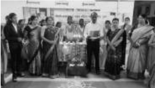
गृहअर्थशास्त्र अभ्यास मंडळाचे उदघाटन