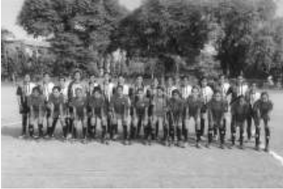
University Silver Medal Football Team