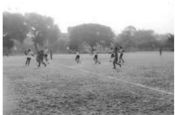
Sant Gadgebaba Amravati University Inter Collegiate Football Tournaments Held at DCPE Amravati