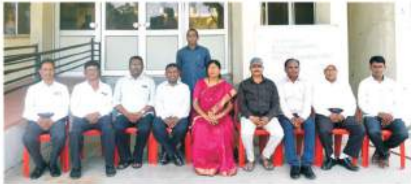
प्राचार्यासवे कार्यालयीन कर्मचारी वृंद