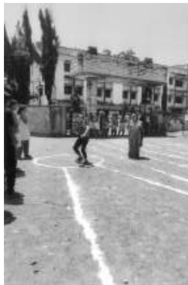
Athletics Golafek Competition